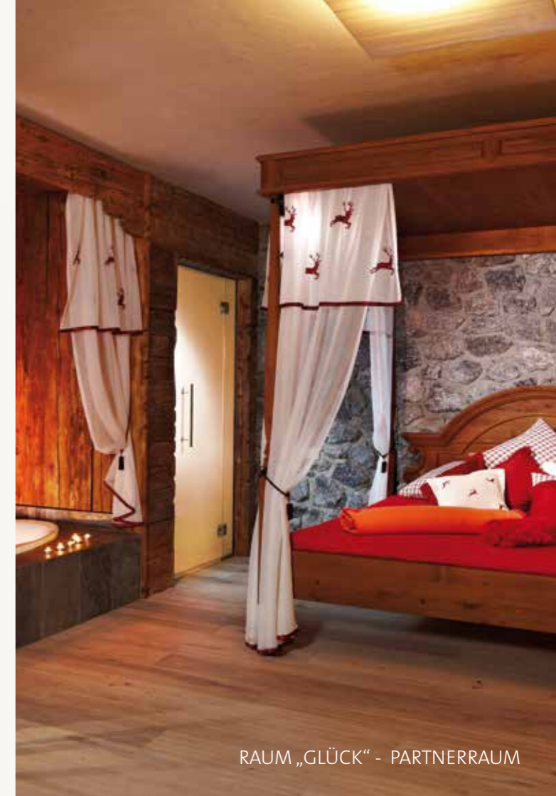
RAUM „GLÜCK“ - PARTNERRAUM

Für eine Behandlung im Wert ab Euro 40,-- bezahlen Sie keinen Saunaeintritt mehr